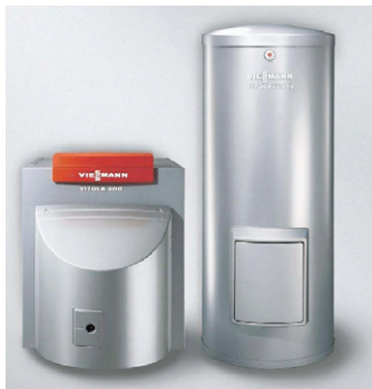
Moderne Heizkessel benötigen wesentlich weniger Energie als uralte Anlagen.