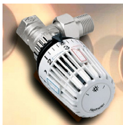
Thermostatventile helfen beim Sparen, wenn man sie richtig verwendet.

Thermostatventile sollen eine eingestellte Raumtemperatur halten. Das Ventil öffnet, wenn die Einstellung unterschritten wird, das Ventil schließt, wenn die Temperatur erreicht ist. Wird der Heizkörper zugebaut oder zugehängt, kann das Thermostatventil nicht mehr die Raumtemperatur erfassen, sondern nur noch die erhöhte, gestaute Wärme. Um zur gewünschten Raumtemperatur zu kommen, muss die Einstellung höher gewählt werden, als eigentlich erforderlich wäre. Die Funktion des Thermostatventils ist gestört. Der gewünschte Einsparungseffekt ist nicht mehr möglich. Lässt sich eine Verbauung nicht verhindern, so sollten Sie den Heizkörper nach Möglichkeit gar nicht anstellen oder Thermostatventile mit Fernfühlern verwenden.