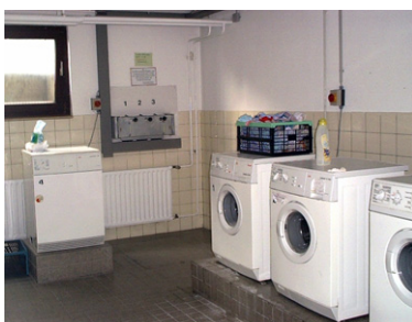
Leider keine Seltenheit. Eine voll aufgedrehte Heizung und gleichzeitig gekippte Fenster in Waschküchen und Trockenräumen. Keiner kümmert sich darum. Schlimmer kann man Wärmeenergie nicht vergeuden.

Trockenräume, Waschküchen und Treppenhäuser sind besondere Schwachpunkte. Hier wird in Mehrfamilienhäusern oft unkontrolliert geheizt, weil viele meinen, dass es sie selbst nichts kostet. Dabei gehen die Kosten dieser Allgemeinräume in die Heizkostenabrechnung von jedem Einzelnen ein. Alle sollten deshalb ein Interesse an sinnvoller Beheizung haben. Im Winter sollten auch alle Hausbewohner darauf achten, dass Fenster im Treppenhaus, im Trockenraum oder im Dachboden nicht unnötig geöffnet bleiben. Vor allem in Waschküchen, Trockenräumen und im Keller wird häufig viel zu viel gelüftet. Das erhöht die Heizkosten der Mieter in den Erdgeschosswohnungen zum Teil erheblich.